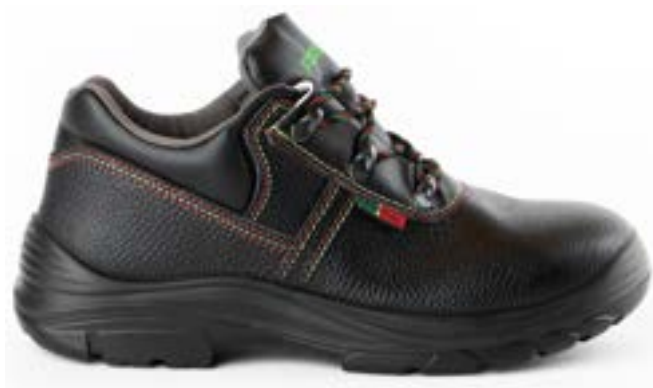
COIMBRA | 1252.40 36-47

EN ISO 20345:2011 CC S3 SRC BIQUEIRA DE PROTEÇÃO : AÇO PUNTERA DE SEGURIDAD : ACERO PALMILHA DE PROTEÇÃO : AÇO PLANTILLA DE SEGURIDAD : ACERO SOLA : PU DIRETAMENTE INJETADO SUELA : INYECCIÓN DIRECTA PU