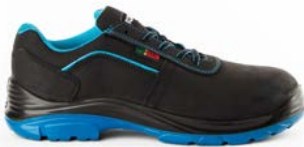
SANTARÉM | 1297.91 36-47

EN ISO 20345:2011 CC S3 SRC BIQUEIRA DE PROTEÇÃO : COMPOSITE PUNTERA DE SEGURIDAD : COMPOSITE PALMILHA DE PROTEÇÃO : KEVLAR PLANTILLA DE SEGURIDAD : KEVLAR SOLA : PU DIRETAMENTE INJETADO - DUPLA DENSIDADE SUELA : INYECCIÓN DIRECTA PU