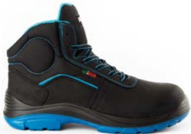
BRAGA | 1697.91 36-47

EN ISO 20345:2011 CC S1P SRC BIQUEIRA DE PROTEÇÃO : AÇO PUNTERA DE SEGURIDAD : ACERO PALMILHA DE PROTEÇÃO : AÇO PLANTILLA DE SEGURIDAD : ACERO SOLA : PU DIRETAMENTE INJETADO - DUPLA DENSIDADE SUELA : INYECCIÓN DIRECTA PU