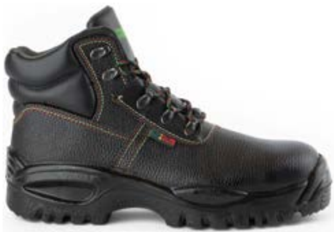
GUARDA | 6052.00 36-47

EN ISO 20345:2011 CC S3 SRC BIQUEIRA DE PROTEÇÃO : AÇO PUNTERA DE SEGURIDAD : ACERO PALMILHA DE PROTEÇÃO : AÇO PLANTILLA DE SEGURIDAD : ACERO SOLA : PU DIRETAMENTE INJETADO SUELA : INYECCIÓN DIRECTA PU