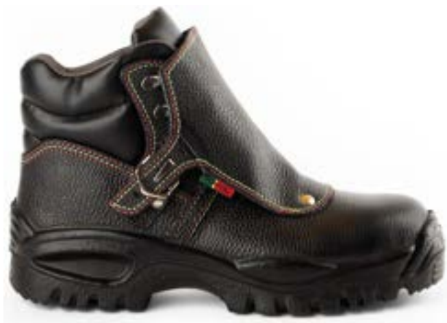
FUNDÃO | 6052.20 39-47

EN ISO 20345:2011 CC S3 SRC BIQUEIRA DE PROTEÇÃO : AÇO PUNTERA DE SEGURIDAD : ACERO PALMILHA DE PROTEÇÃO : AÇO PLANTILLA DE SEGURIDAD : ACERO SOLA : PU DIRETAMENTE INJETADO SUELA : INYECCIÓN DIRECTA PU