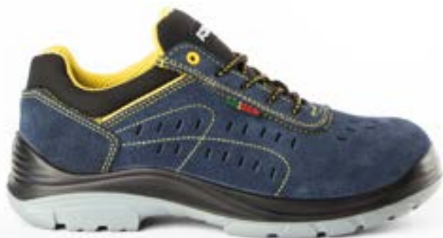
ALBUFEIRA | 1239.91 36-47