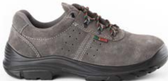
TAVIRA | 1212.46 36-47

EN ISO 20345:2011 CC S1P SRC BIQUEIRA DE PROTEÇÃO : COMPOSITE PUNTERA DE SEGURIDAD : COMPOSITE PALMILHA DE PROTEÇÃO : KEVLAR PLANTILLA DE SEGURIDAD : KEVLAR SOLA : PU DIRETAMENTE INJETADO - DUPLA DENSIDADE SUELA : INYECCIÓN DIRECTA PU